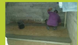
Construcción de pisos