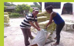
Entrega del material